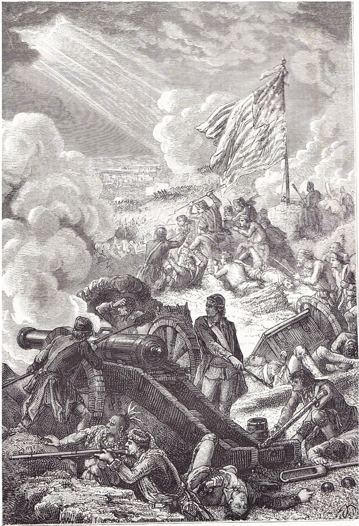
DÉFENSE DES HAUTEURS DE BUNKER'S HILL

« Défense des hauteurs de Bunker's Hill »